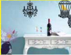
06 ウォールステッカー