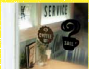
07 ショップディスプレイ